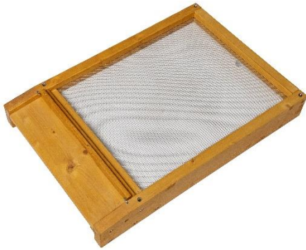
ZA01 Unterboden in Holz