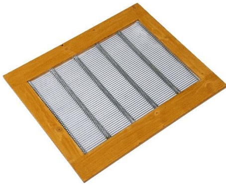
ZA61 Absperrgitter mit Rahmen