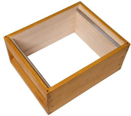
ZA11 Brutraum- / Honigraumzarge